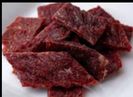
ビーフジャーキー