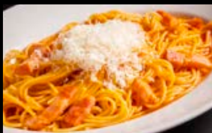
ポモドーロ Spaghetti pomodoro sauce ¥900