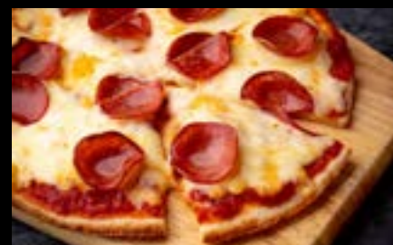
クリスピーピザ サラミ Crispy pizza salami ¥900