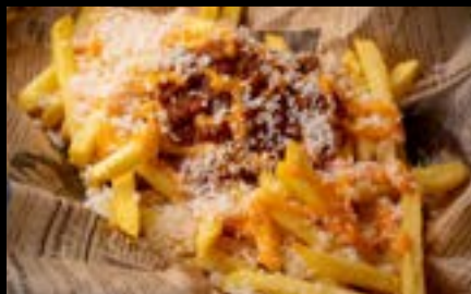
フライドポテトチリビーンズチーズ French fries with chili beans&cheese ¥800