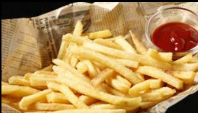
フライドポテト (塩・チーズ胡椒・バター醤油)

French fries (salt or cheese&pepper or butter&soysause)