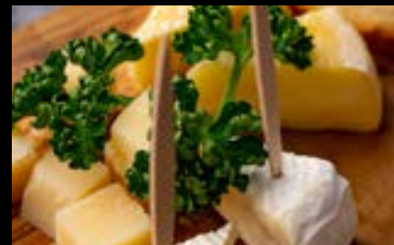
チーズ盛り合わせ Assorted Cheese ¥800