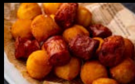
揚げニョッキとソーセージ Fried gnocchi and sausage ¥800