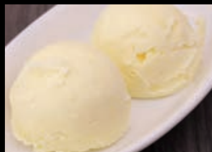
本日のジェラート