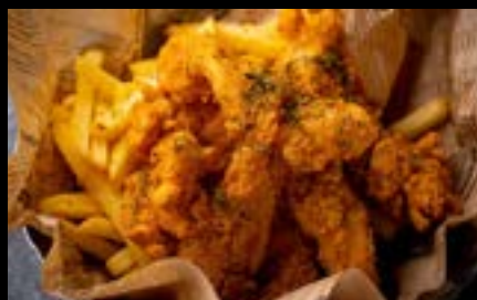
チキン&ポテト Chicken & potatoes ¥800