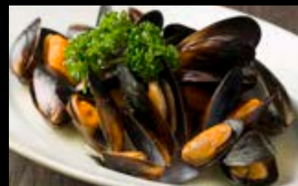
ムール貝 白ワイン蒸し Mussels steamed with white wine ¥800