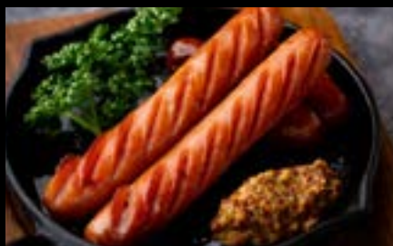
ソーセージMIX Assorted sausage ¥800