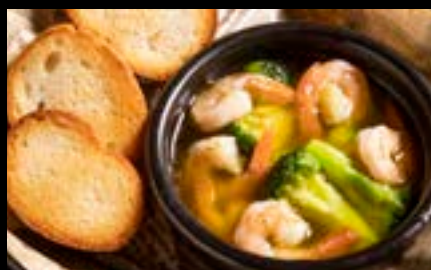
エビのアヒージョ Shrimp Ajillo ¥800