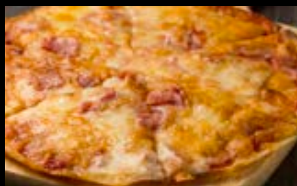
NYクリスピーピザ Crispy pizza ¥900