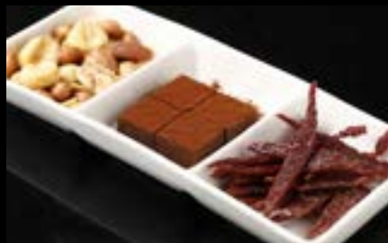
おつまみ3点盛り合わせ Appetizers assorted 3points ¥800