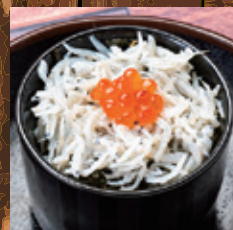
釜揚げしらすご飯