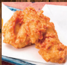
コッコちゃんの 紅生姜ザンギ (2個)