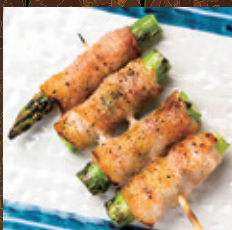
アスパラ肉巻き (1本)