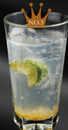
柚子ジントニック Citron Gin & Tonic ジン + トニックウォーター + ライム + 柚子シロップ 700yen