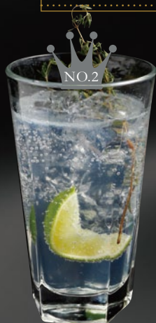
こだわりのジントニック (メンズ) 42 BAR SPECIAL Gin & Tonic ジン + トニックウォーター + ライム + タイム 700yen