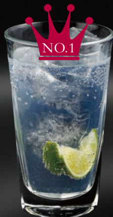
こだわりのジントニック (レディース) 42 BAR SPECIAL Gin & Tonic ジン + トニックウォーター + プレミアムマスカットリキュール + ライム 700yen